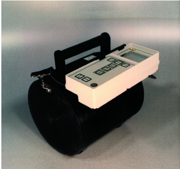
Modèle 190N montré avec ensemble lecteur modèle 190 et détecteur modèle RP-N